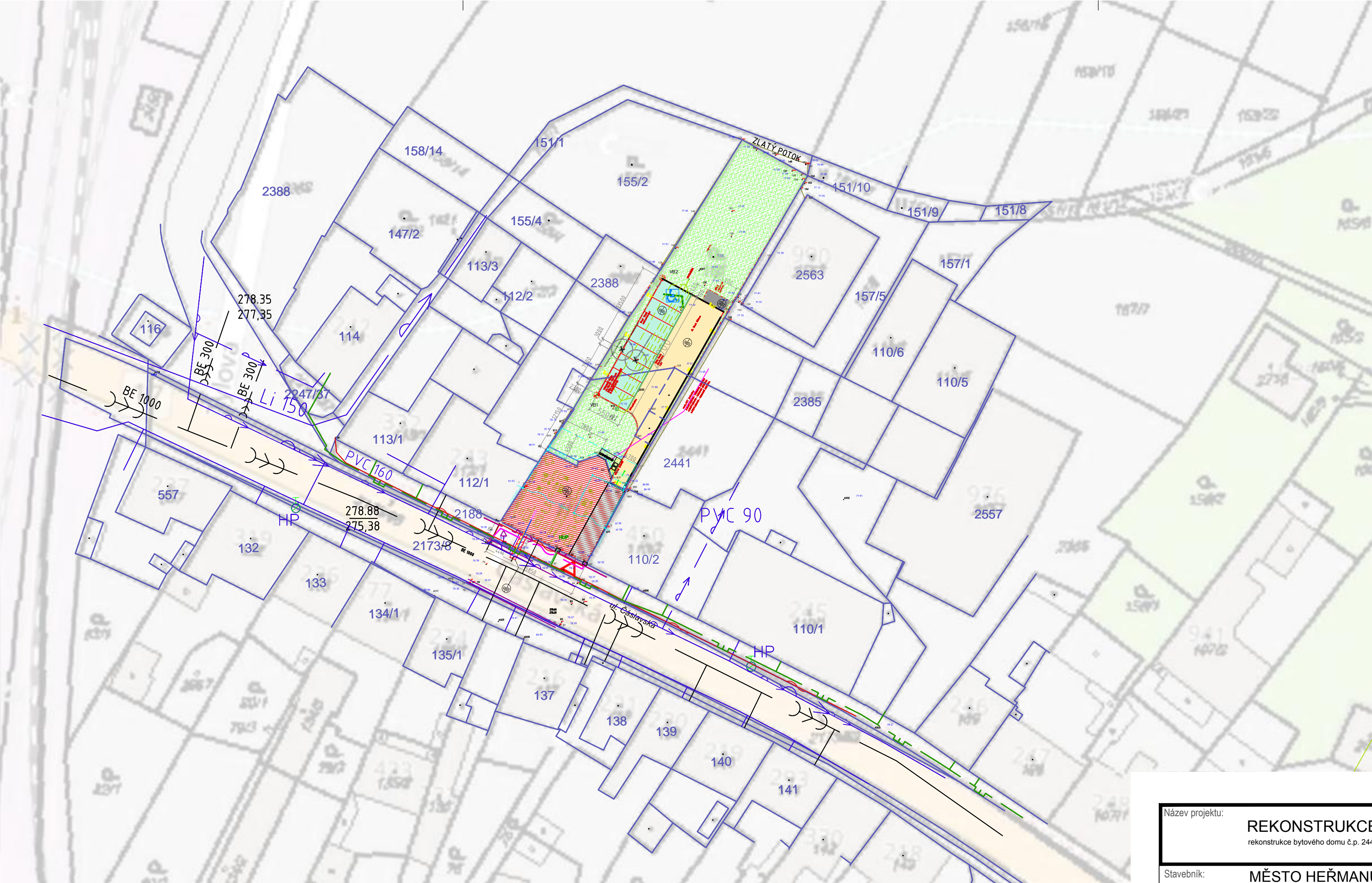
ZÁKLADNÍ VYTÝČOVACÍ BODY: